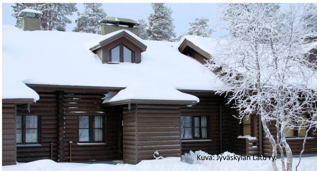
Kuva: Jyväskylän Latu ry.